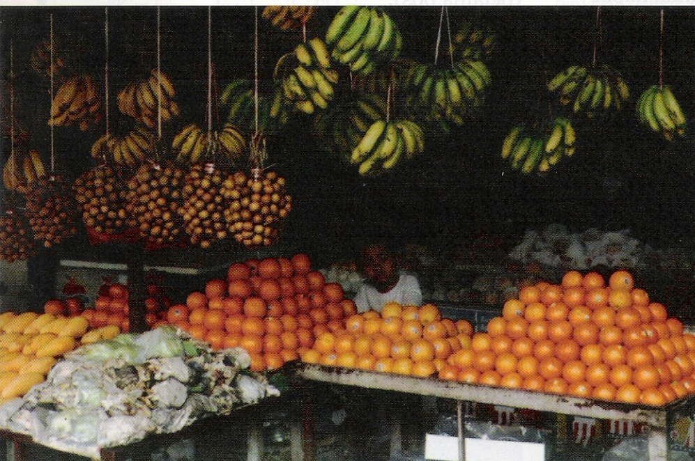
• Buah-buahan import dikenakan cukai jualan - Gambar Hiasan