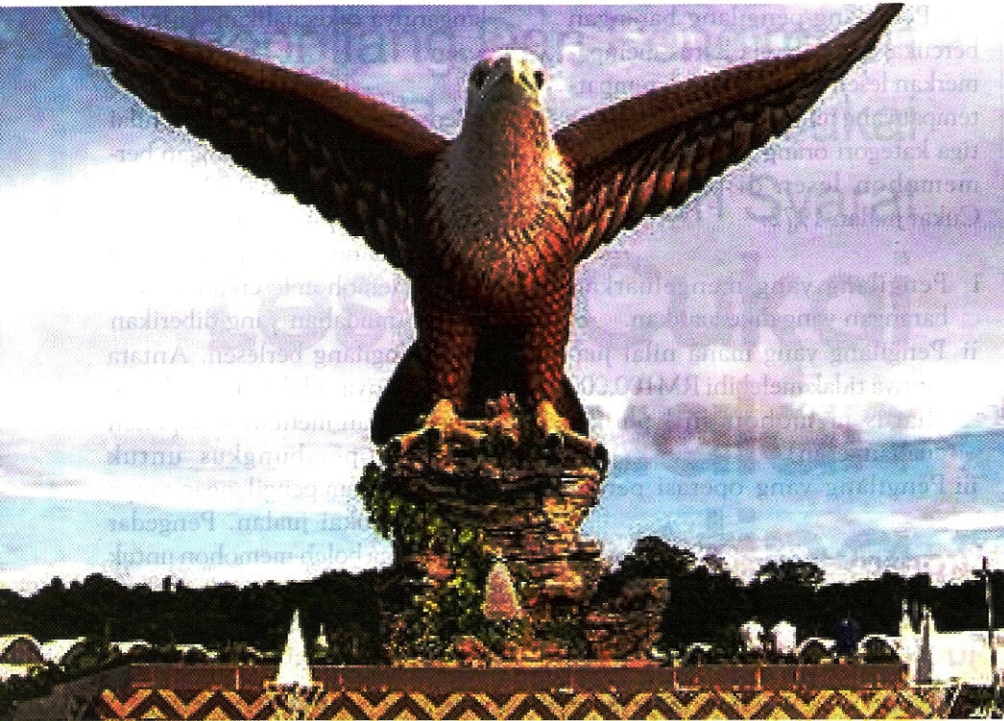
• Barangan yang diimport atau dikilangkan di Langkawi adalah bebas cukai - Gambar Hiasan

dijual dan dilupus serta jumlah cukai jualan tahunan yang dibayar.