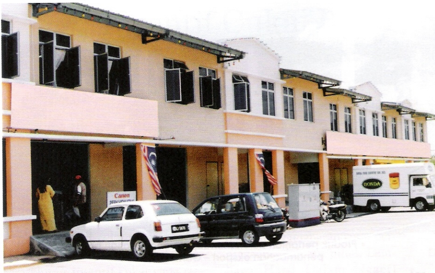
• Sewa boleh dianggap pendapatan perniagaan – Gambar Hiasan