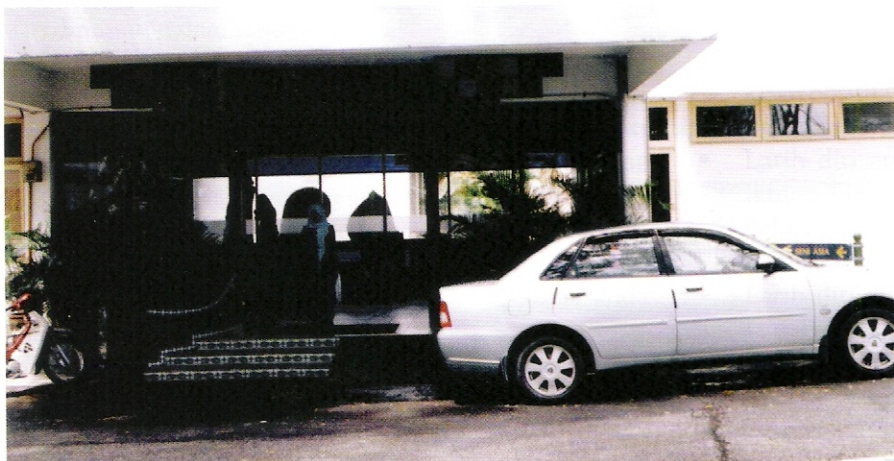
• Banyak entiti perniagaan yang ditubuhkan atas entiti Sendirian Berhad atau Berhad – Gambar Hiasan