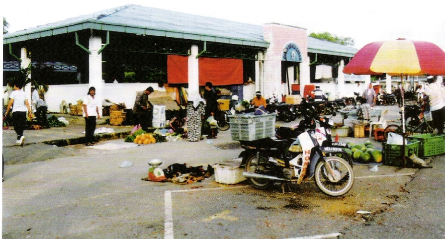
• Produk pertanian boleh mendapat pengecualian bagi penambahan eksport – Gambar Hiasan

Setiap syarikat atau perniagaan akan mempunyai orang penting ( keyman ) yang merupakan penyumbang terbesar dan terpenting dalam perniagaan. Sekiranya berlaku kecelakaan atau kemalangan terhadap individu tersebut, ini akan menjejaskan perniagaan. Oleh itu, syarikat akan membiayai insurans bagi individu tersebut untuk mendapatkan